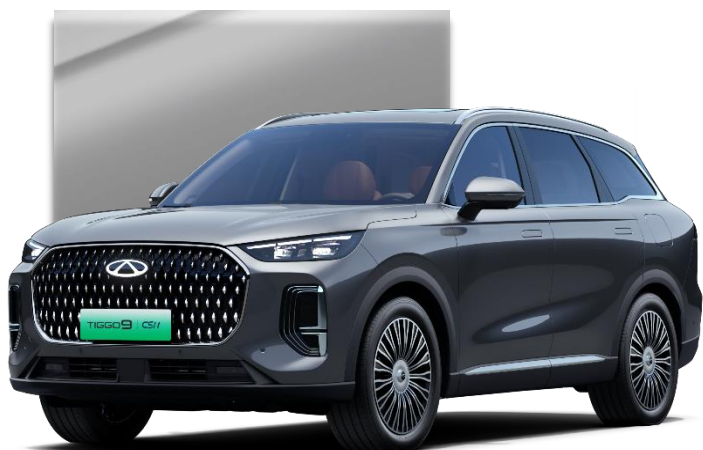
Universe Gray (UEM)