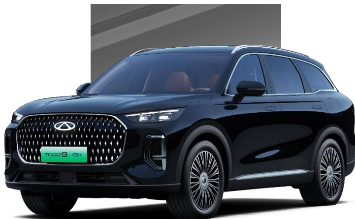
Pine Black (CLM)