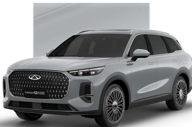
Tech Gray (GXM)